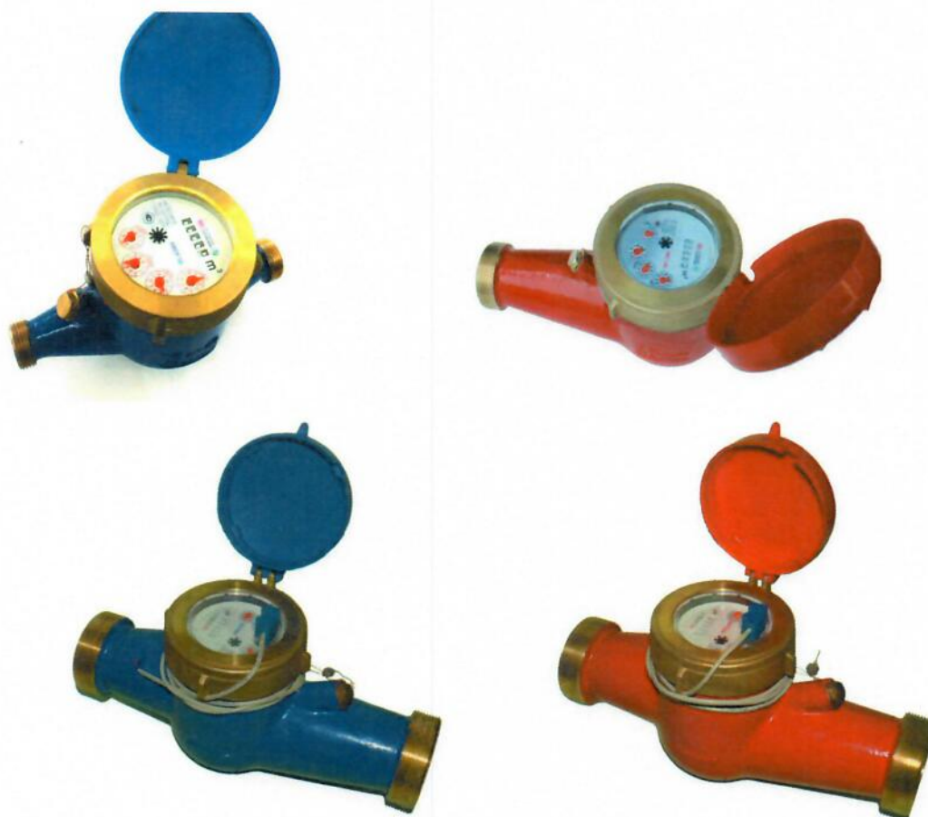
Рисунок 1 – Общий вид счётчиков холодной и горячей воды крыльчатых многоструйных МВС

Общий вид счётчиков представлен на рисунке 1.