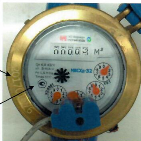
Рисунок 3 – Место нанесения знака утверждения типа и заводского номера на счётчики холодной и горячей воды крыльчатые многоструйные МВС