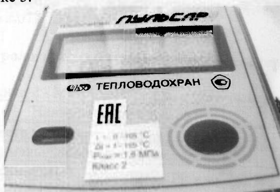
а) вид спереди

Маркировка вычислителей теплосчетчиков модификаций «Пульсар» К приведена на рисунке 3.