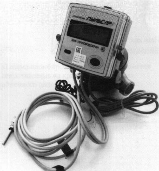
а) модификаций «Пulsар» К

Общий вид теплосчетчиков показан на рисунке 1.