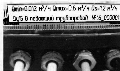
б) вид снизу