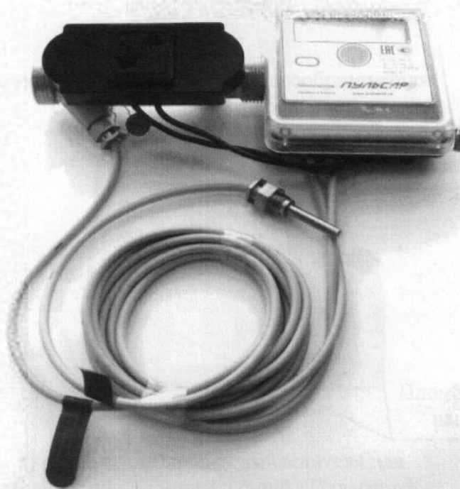
в) модификаций «Пulsар» У