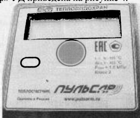
а) вид спереди

Маркировка вычислителей теплосчетчиков модификаций «Пульсар» Т, «Пульсар» У и «Пульсар» УД приведена на рисунке 4.