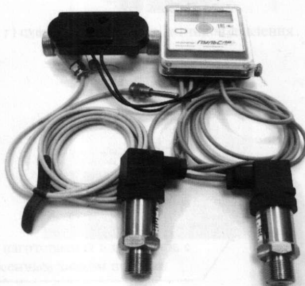
д) модификаций «Пulsар» УД