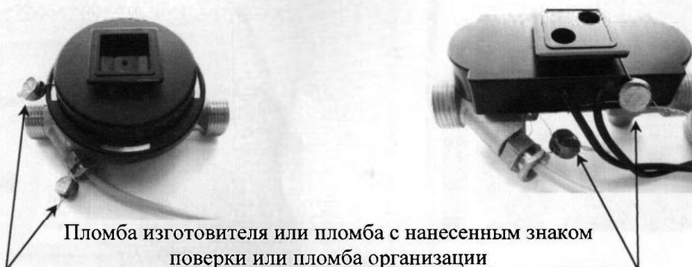
Схема пломбировки теплосчетчиков представлена на рисунке 2.

а) схема пломбировки термопреобразователя сопротивления на крыльчатых датчиках объемного расхода