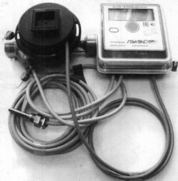
б) модификаций «Пulsар» Т