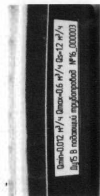
б) вид справа