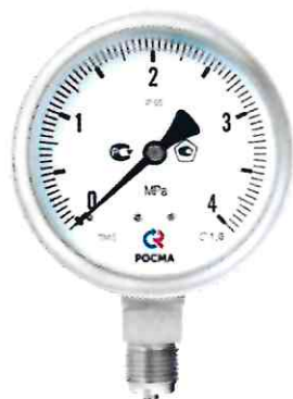
Рисунок 9 – Манометры показывающие ТМ, ТВ, ТМВ серия 21 с повышенной безопасностью