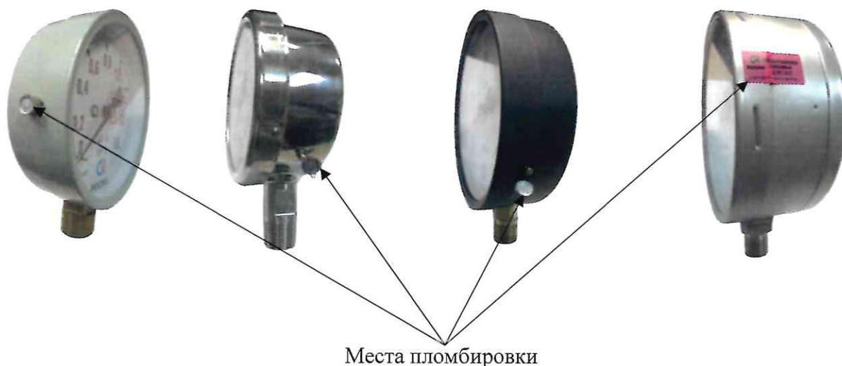
Рисунок 13 - Схемы пломбировки приборов от несанкционированного доступа

Защита от несанкционированного доступа осуществляется при помощи опломбирования корпуса прибора пломбой. Также возможно пломбирование путем нанесения на кольцо и боковую поверхность корпуса прибора специальной наклейки, которая разрушается при попытке ее удалить и вскрыть корпус или пломбирование с использованием пломбировочной чашки. Опломбирование корпуса ограничивает доступ к внутренним элементам конструкции. Схемы пломбировок, предотвращающих доступ к элементам конструкции, представлены на рисунке 13. Обозначение места нанесения знака поверки представлено на рисунке 14.