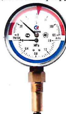
Рисунок 12 – Манометры показывающие ТМТБ (термоманометр)