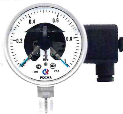
Рисунок 11 – Манометры показывающие ТМ, ТВ, ТМВ серия 21 с электроконтактной приставкой (ЭКП)