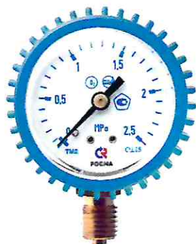
Рисунок 3 – Манометры показывающие ТМ, серия 10, газовые