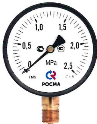
Рисунок 1 – Манометры показывающие ТМ, ТВ, ТМВ серия 10

Общий вид приборов представлен на рисунках 1 - 12.