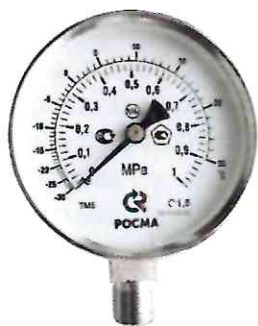
Рисунок 5 – Манометры показывающие ТМ, ТМВ серия 11