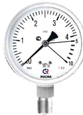
Рисунок 10 – Манометры показывающие ТМ, ТВ, ТМВ серия 21 с защитой от перегрузки