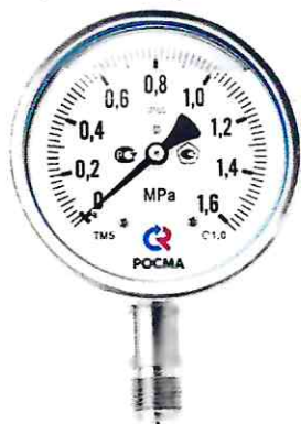
Рисунок 7 – Манометры показывающие ТМ, ТВ, ТМВ серия 21