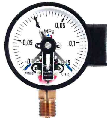
Рисунок 2 – Манометры показывающие ТМ, ТВ, ТМВ серия 10 с электроконтактной приставкой (ЭКП)