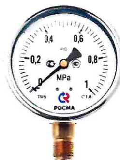
Рисунок 6 – Манометры показывающие ТМ, ТВ, ТМВ серия 20