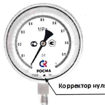
Рисунок 8 – Манометры показывающие ТМ, ТВ, ТМВ серия 21 Р.МТИ для точных измерений