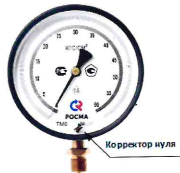
Рисунок 4 – Манометры показывающие ТМ, ТМВ серия 10 Р.МТИ для точных измерений