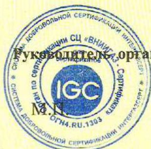
Схема сертификации 2с.