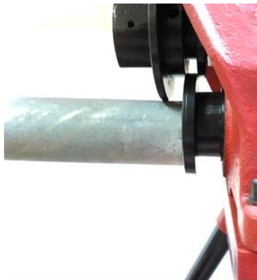
Рис. 2 Установка трубы