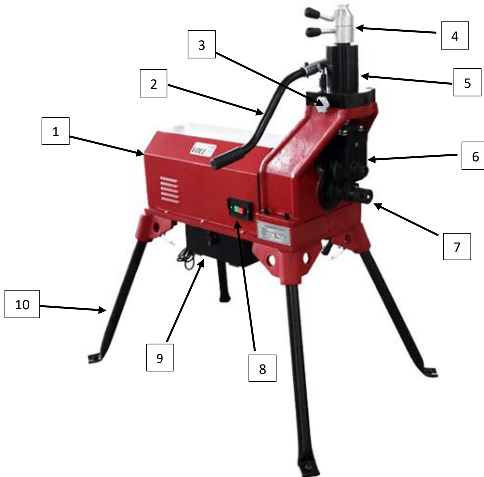
Рис. 1 Конструкция желобонакатного станка VOLL V-Groover